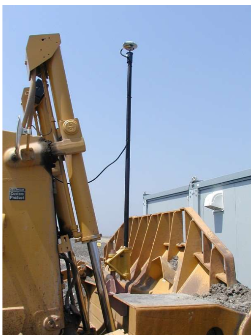
（排土板へのGPSアンテナ設置状況）