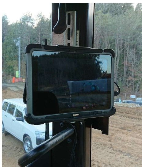
（キャビン内へのシステム機器設置状況）

システム導入・設置から、取り扱い指導まで対応させていただきます。また、機材についてはレンタルも行っております。